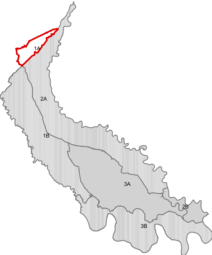
Planimetria di riferimento